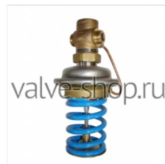
Регулятор давления Danfoss AVD