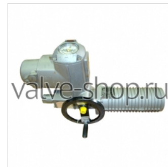
Электроприводы неполнооборотные AUMA ASR