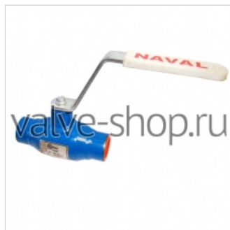
Кран шаровой Naval (резьбовой)