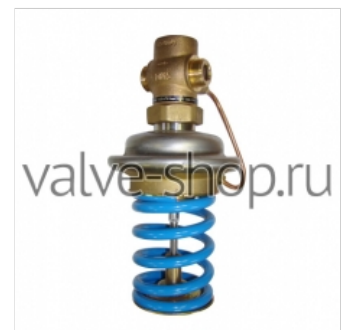
Регулятор давления Danfoss AVD