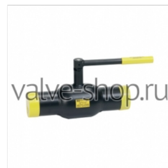
Кран шаровой стальной Ballomax