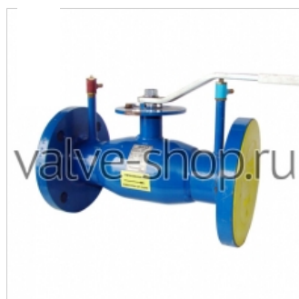
Кран шаровой линейный