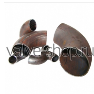
Отводы стальные крутоизогнутые