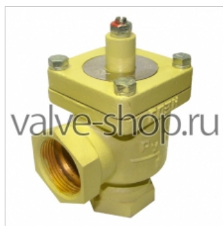
Регулятор температуры РТЦГВ