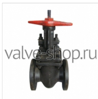
Задвижка чугунная 30C46BP