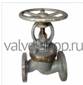
Клапан (вентиль) стальной