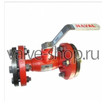
Шаровый кран Naval для пара (фланцевый)