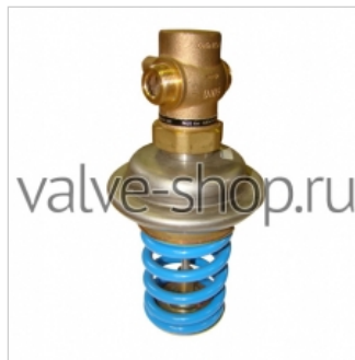
Регулятор давления Danfoss AVA 772 р.