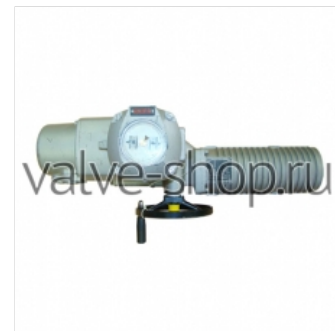
Электроприводы неполнооборотные взрывозащищенные AUMA SA ExC