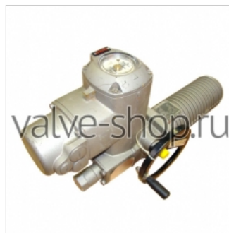
Электроприводы неполнооборотные AUMA SGR