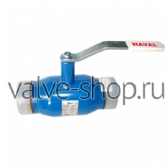
Кран шаровой стальной Naval (сварной)