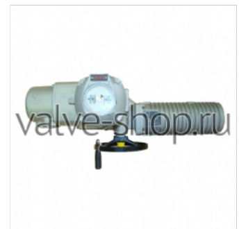
Электроприводы неполнооборотные взрывозащищенные AUMA SA ExC