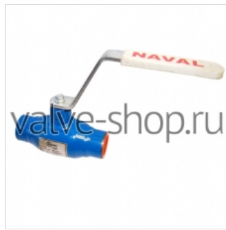
Кран шаровой Naval (резьбовой) 2 800 р. купить