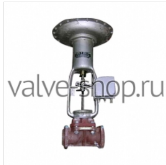
Клапан регулирующий мембранный футерованный фланцевый 25Ч5П. 25Ч7П 11 500 р. купить