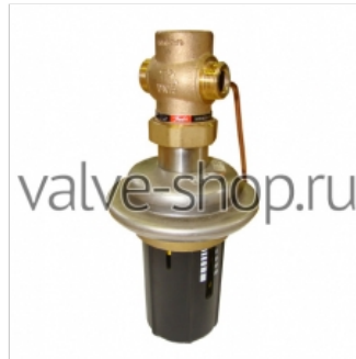
Регулятор давления Danfoss AVP 730 р. купить