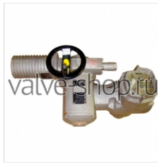
Электроприводы неполнооборотные AUMA SA (редуктор GS)