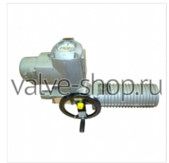
Электроприводы неполнооборотные AUMA ASR