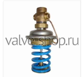
Регулятор давления Danfoss AVD 772 р. купить